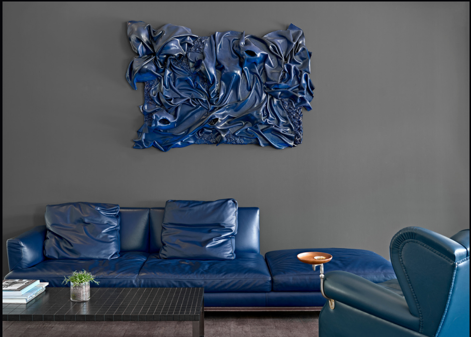
LEX ITALICA (LIM1- 2018) tetra-yarn, cement 175 x 120 cm