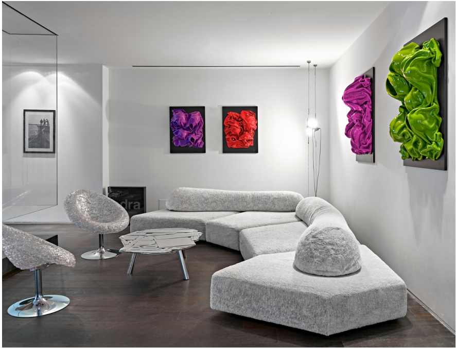
LEX ITALICA ed. Gonzaga (LIG1 - 2023) the pink one LEX ITALICA ed. della Rovere (LIR3- 2023) the green one tetra-yarn, eco-resin 110x 75cm