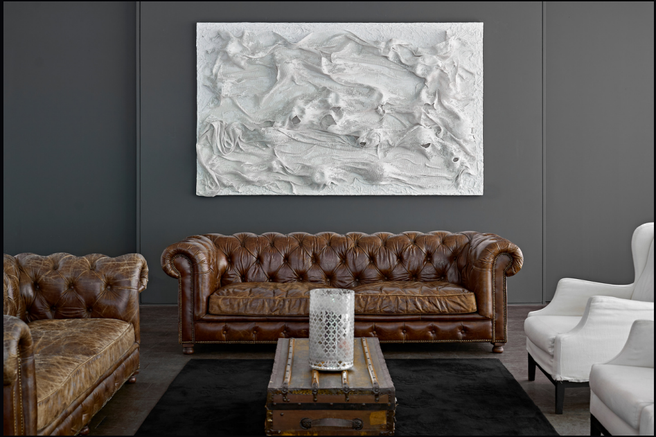
LEX ITALICA (LI1 - 2015) tetra-yarn, cement 250 x 150 cm