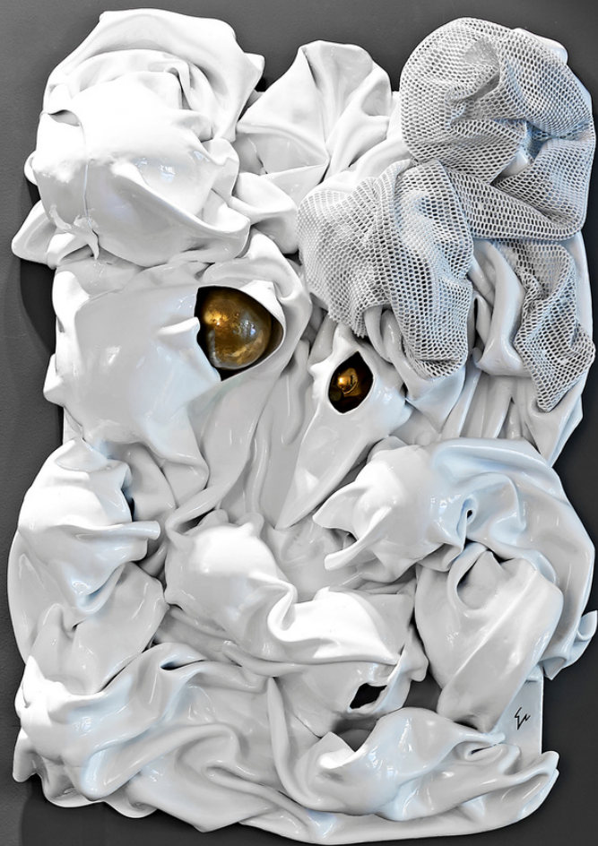
LEX ITALICA (LI25 - 2023) tetra-yarn, eco-resin 110 x 75 cm