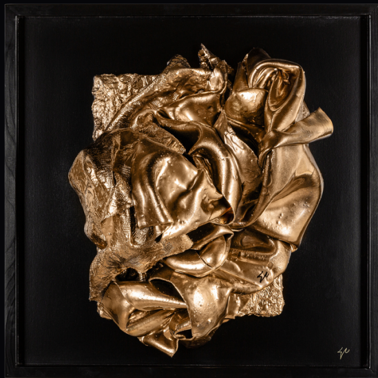
from top left: LEX ITALICA ed. Borbone (LI16- 2020); (LI19- 2020); (LI18- 2020) tetra-yarn, cement 62,5 x 62,5 cm