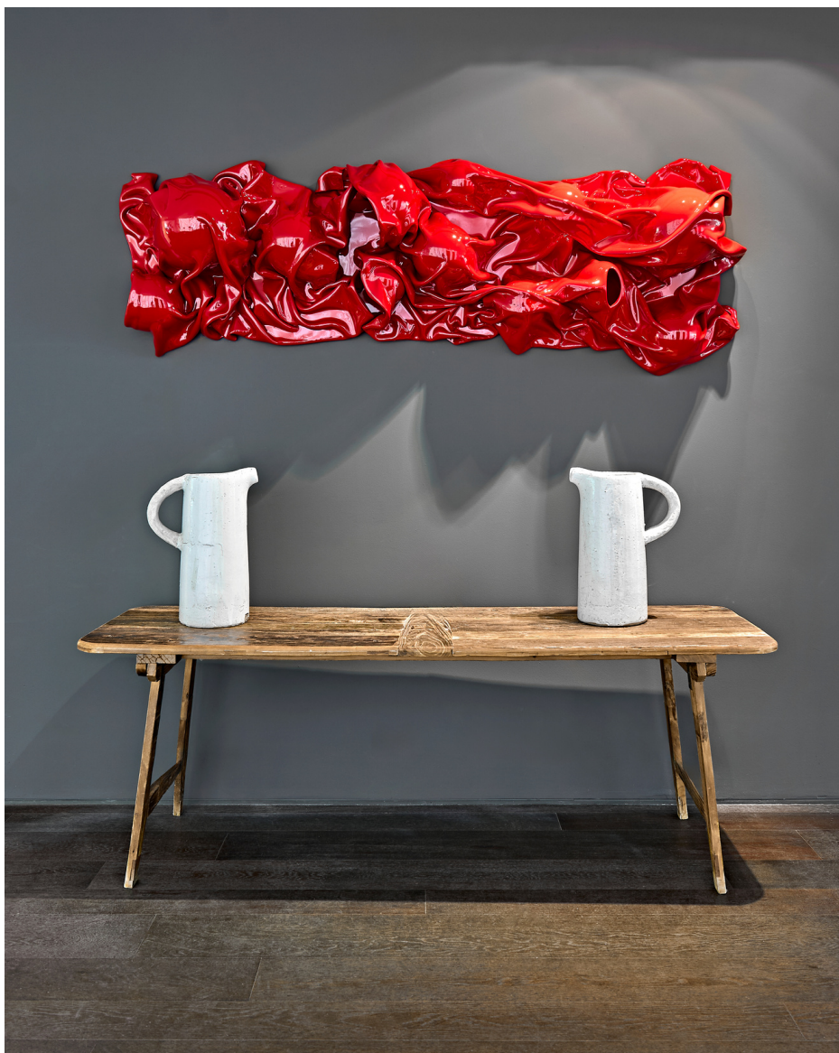
LEX ITALICA ed. Lucrezia Borgia (LILB33 - 2023) the red one tetra-yarn, eco-resin 200 x 65 cm