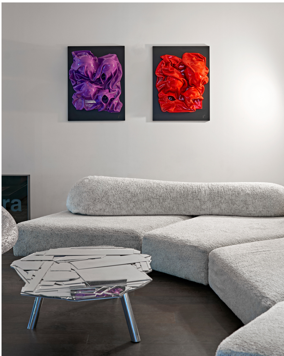
LEX ITALICA ed. Medici (LIM10 - 2023) the violet one LEX ITALICA ed. Lucrezia Borgia (LILB31 - 2023) the red one tetra-yarn, eco-resin 85 x 65 cm