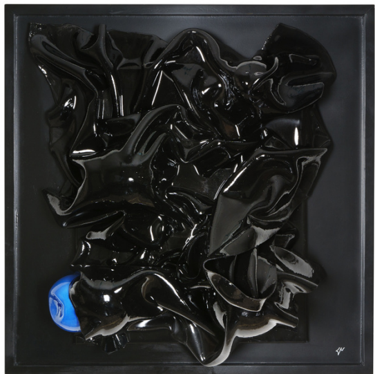
LEX ITALICA ed. Sforza (LIS2 - 2020) left LEX ITALICA ed. Sforza (LIS1 - 2020) right tetra-yarn, eco-resin 80 x 80 cm