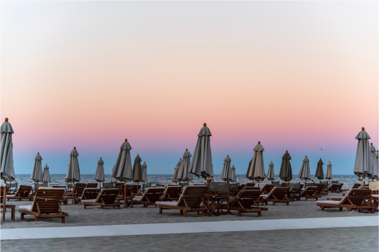
La spiaggia di Milano Marittima.

Sale , una piccola località di villeggiatura immersa fra mare e pineta, destinata alla ricca borghesia milanese, una città giardino . In mezzo ai viali alberati e ai giardini curati, a partire dal 1927 sorgono hotel e ville, ristoranti e colonie. Una storia di turismo d'élite che continua anche oggi, facendo di Milano Marittima una delle località più amate della Riviera Romagnola , grazie ai luoghi e alle occasioni glamour che la cittadina offre.