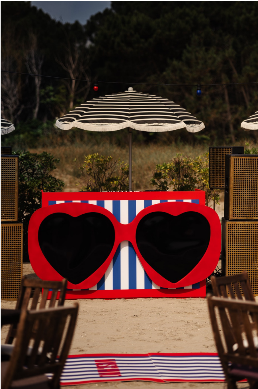
Gli iconici occhiali da sole a cuore di Moschino.