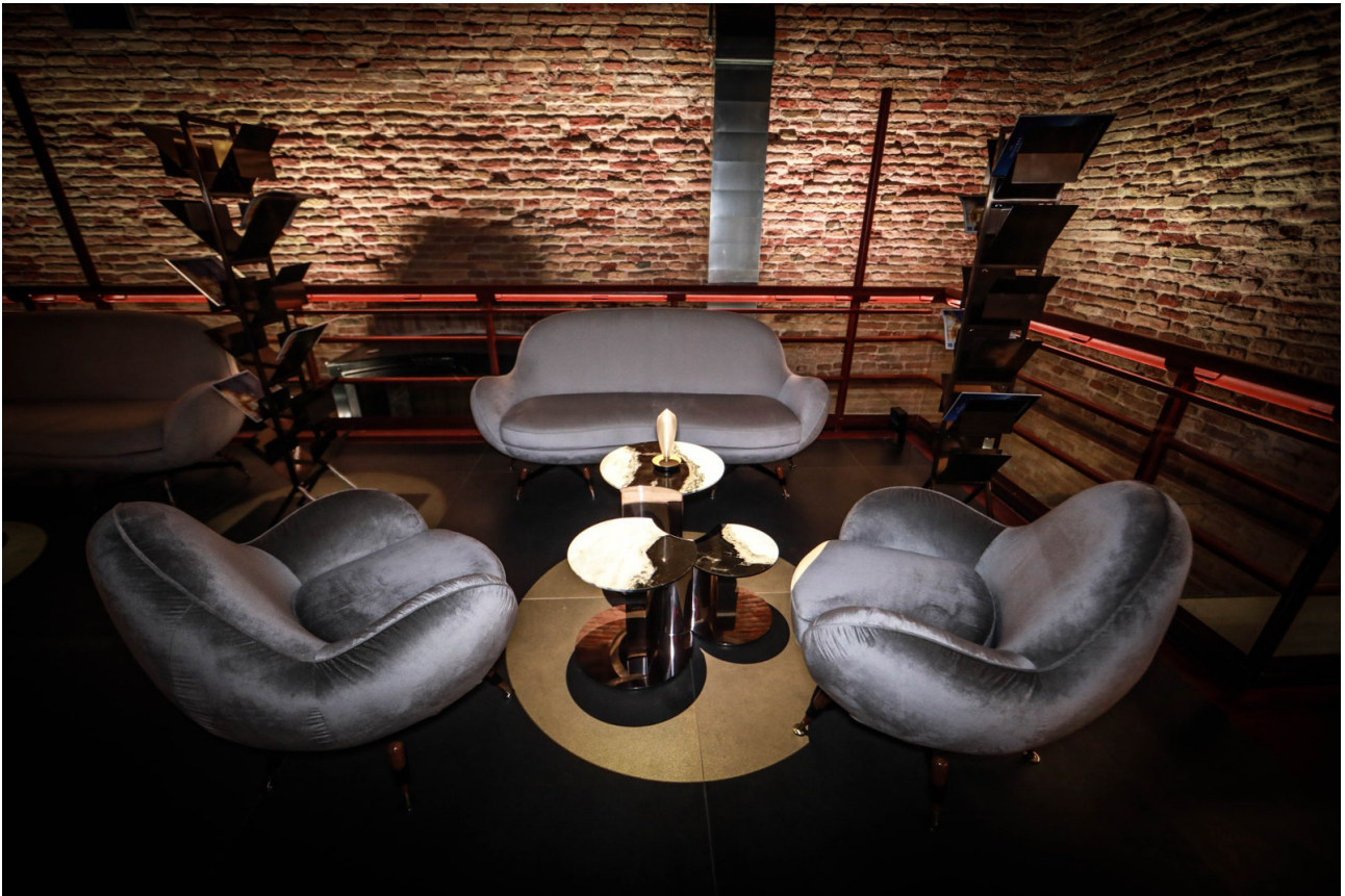
Alla Darsena del sale, poltrone e divanetto Mercury di Visionnaire.