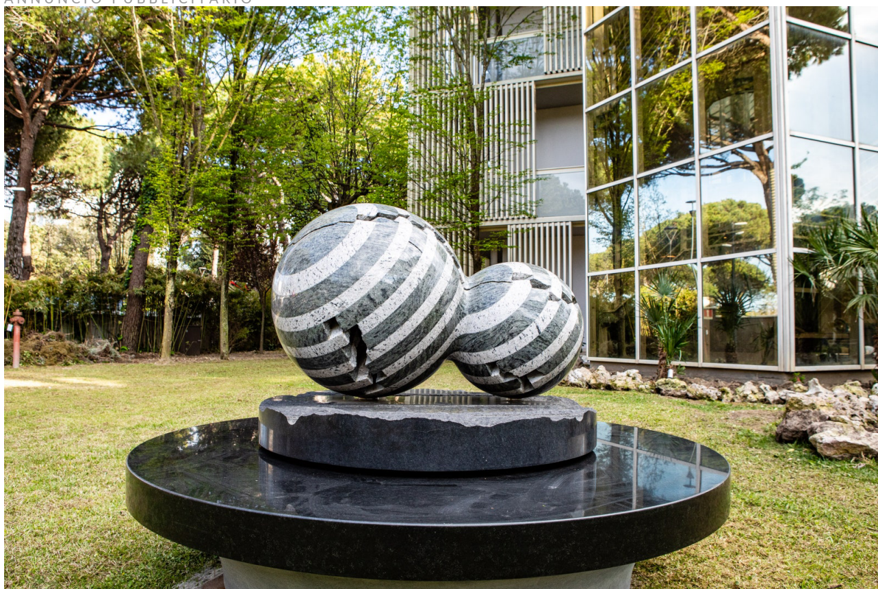
La scultura Due Sfere di Park Eun Sun nel Parco delle Sculture del MarePineta Resort.

«La sperimentazione dell'artista Park Eun Sun inizia dalla materia che lavora quasi scientificamente, esaltandola e, al medesimo tempo, destrutturandola. La caratteristica fondamentale della sua gestualità contemporanea è proprio quella di imporre una frattura. I marmi e i graniti vengono scolpiti, levigati ed infine spaccati per poi essere ricomposti. Queste crepe sono per l'artista metafora della vita, le cicatrici della sofferenza insita nell'esistenza ma al contempo simbolo di