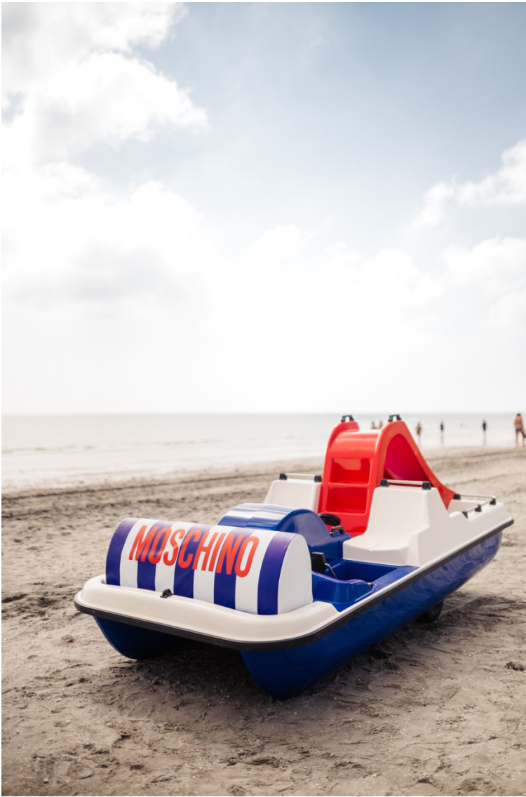
Il pattino customizzato dal brand.