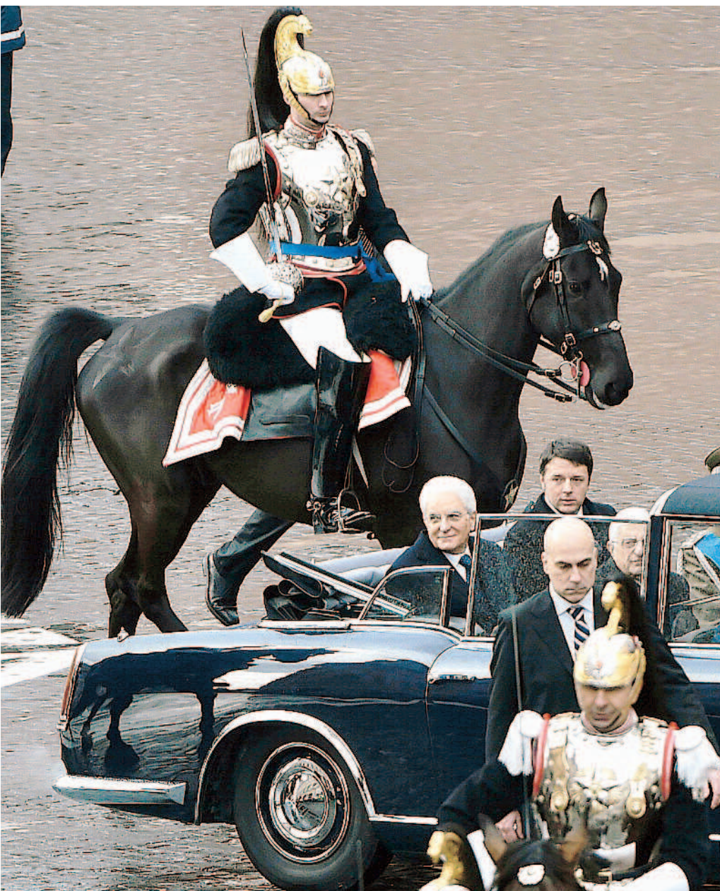
Sergio Mattarella e Matteo Renzi, ieri a Roma, a bordo della Lancia Flaminia scortata da corazzieri a cavallo